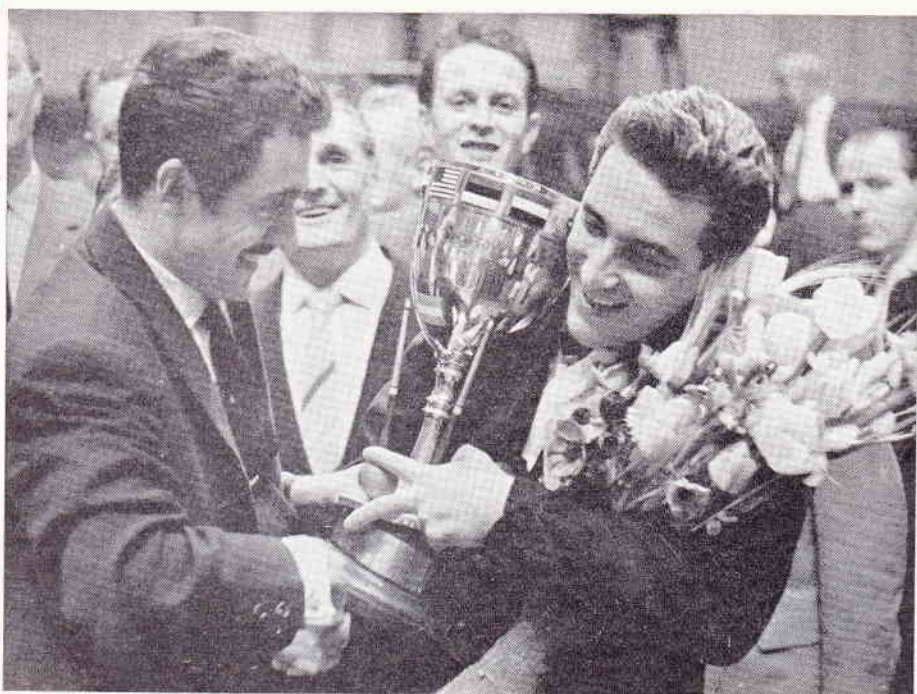
Le vainqueur, Adolfo SUAREZ, portant la Coupe des Nations et des fleurs, reçoit les félicitations d'Egidio VIEIRA.